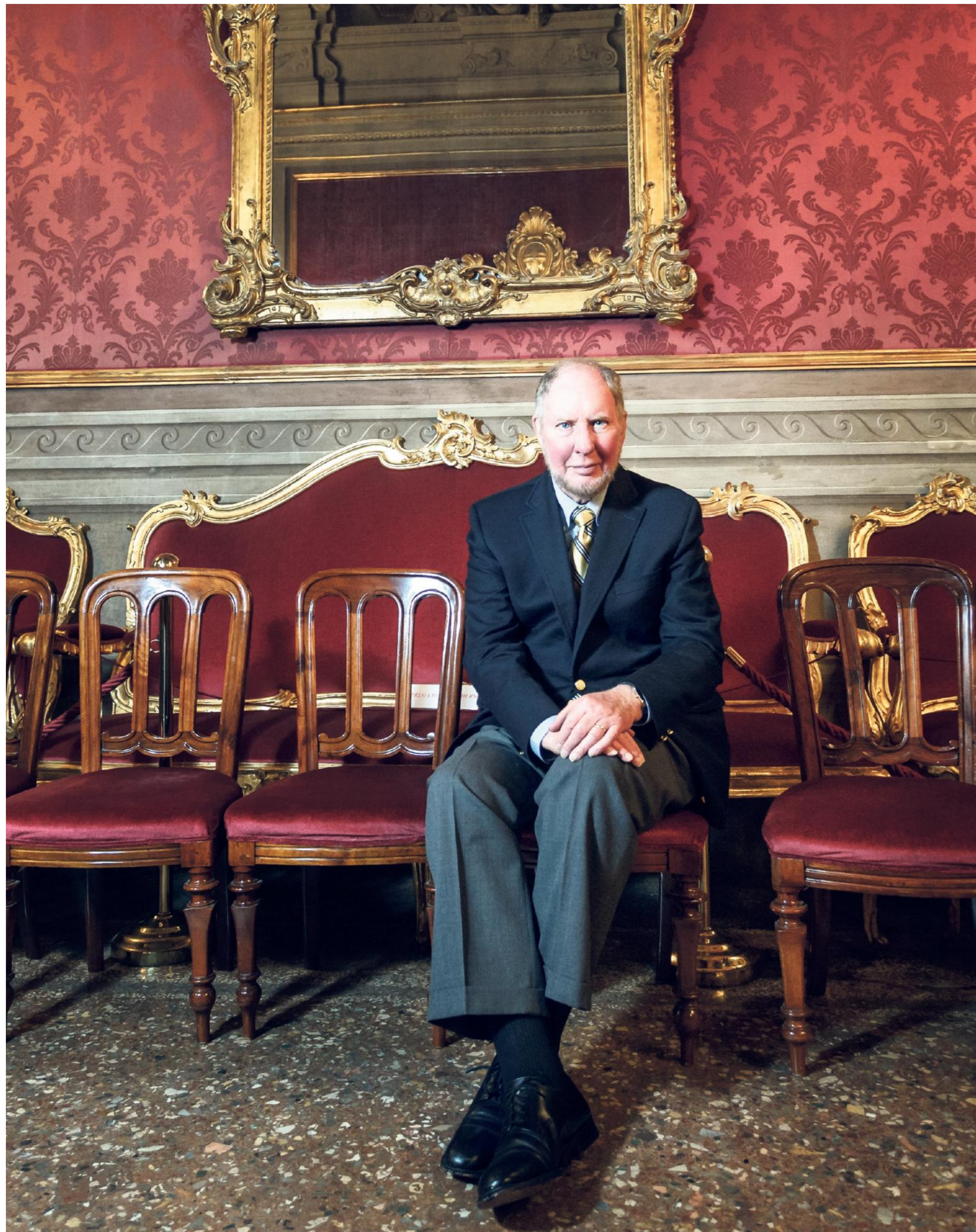
Robert Putnam: „In Amerika verwachten ze alleen nog dat je gaat preken voor eigen parochie, en je tegenstander afmaakt. Ik wil zeltjes winnen, niet mensen aanspreken die dit toch al vinden.”