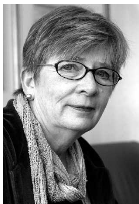
Barbara Ehrenreich

kamers in het laagseizoen – en dan moest ze nog blij zijn dat zij een kamer voor zichzelf had. De meeste werden bewoond door gezinnen of door mensen die erin ploegdienst sloepen. Tot haar ontsteltenis bleken sommige collega's met fulltime banen dakloos te zijn – al vonden ze zelf niet dat ze dakloos waren, ze hadden immers een auto waar ze in konden slapen.