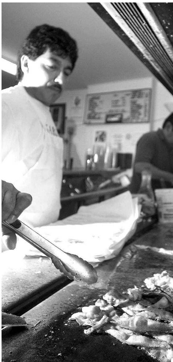
Eén baan met minimumloon – als fastfoodkok, als productiemedewerker, als vakkenvuller bij Wal-Mart – is niet genoeg om van rond te komen. (Foto's Bloomberg)

Wat Ehrenreich als lagelonenwerker nekte, was inderdaad vooral het gebrek aan betaalbare huisvesting. Een appartement was door de borg een ondenkbare luxe, dus moest ze uitwijken naar relatief dure tijdelijke oplossingen. „Thuis' varieerde van een mufte caravan („ik besefte met een schok dat trailer trash een demografische categorie is geworden om naar te streven”) tot motel-